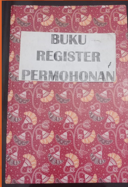
BUKU REGISTER PERMOHONAN INFORMASI